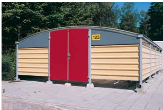
Uitvoering met Trespa en damwandplaten