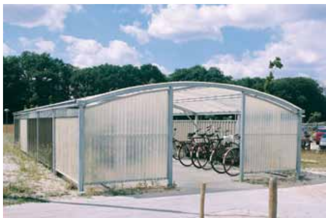
Uitvoering met polyester golfplaten