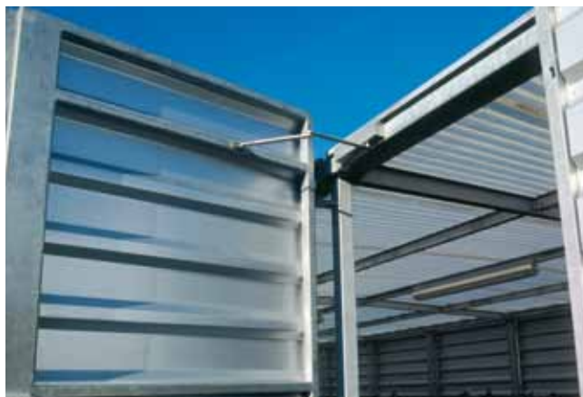
Detail horizontaal damwandprofiel