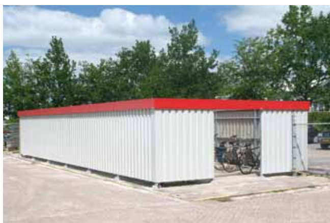
Wanden met verticaal damwandprofiel