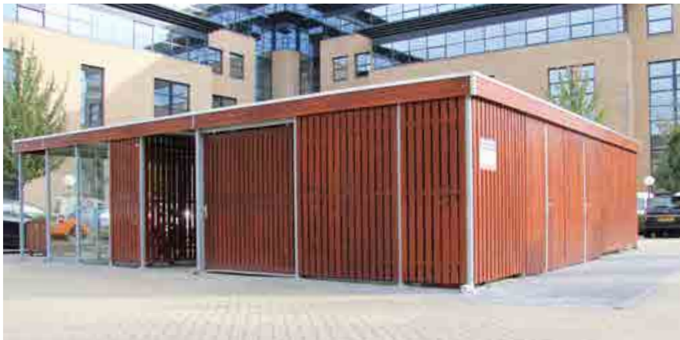
Multifunctionele overkapping met dubbele draaideuren, een schuifdeur en een open ingang