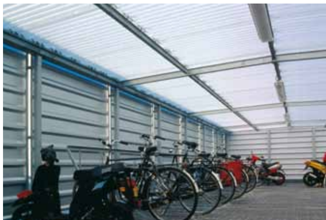
Wanden met horizontaal damwandprofiel