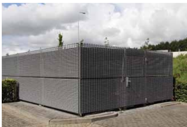
Berging met stalen roosterwanden