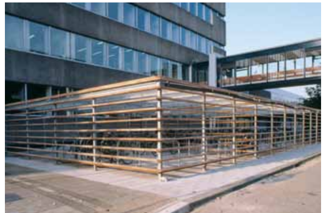
Horizontale houten regels