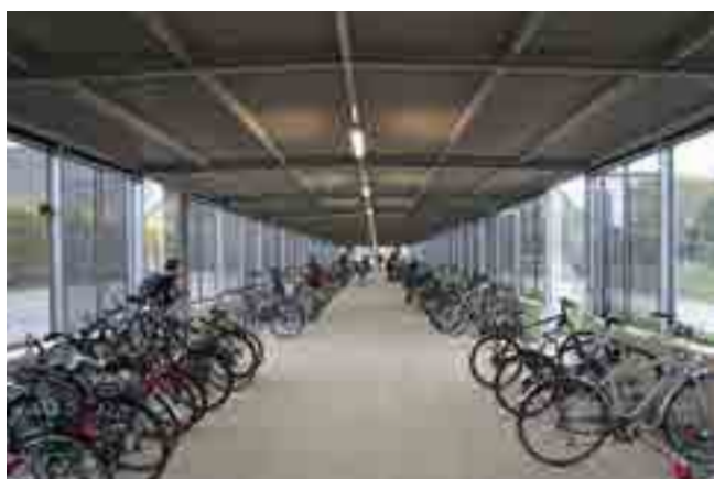
Wanden van geperforeerde staalplaat