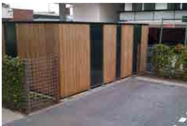
Wanden van Western Red Cedar open latwerk en lichtdoorlatende kunststof beglazing