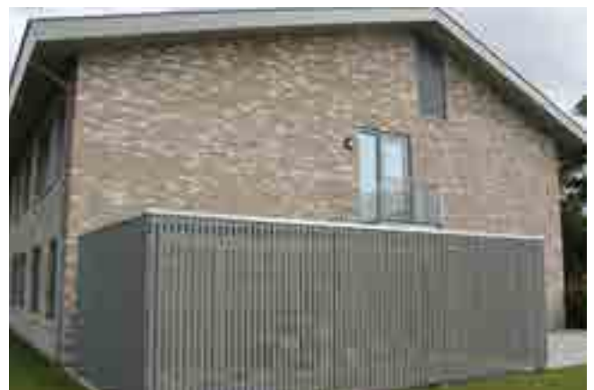
Wanden van Cape Cod