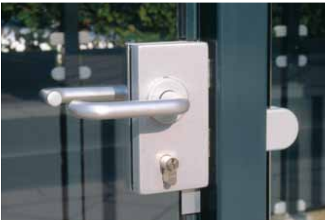
Detail hardglazen deur