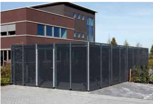
Wanden van geperforeerde staalplaat