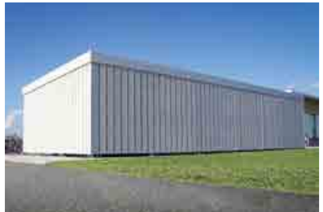
Wanden van vezelcement stroken (Cedral)