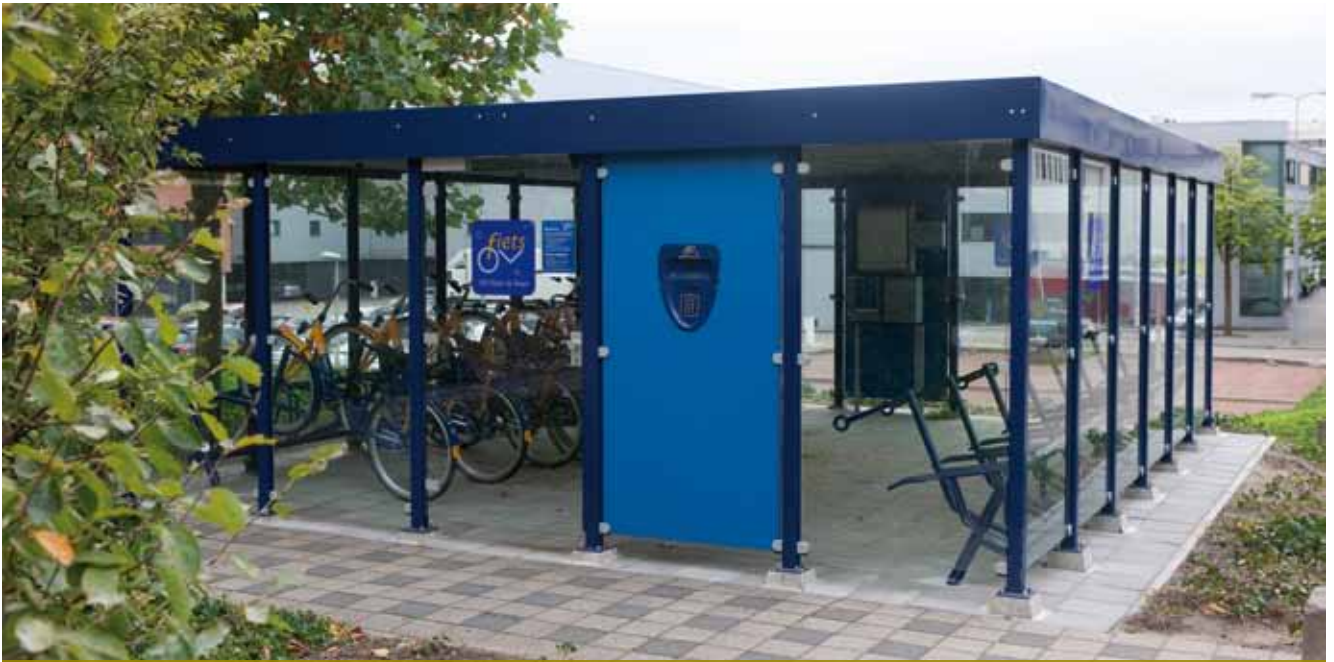
Wanden van hardglas