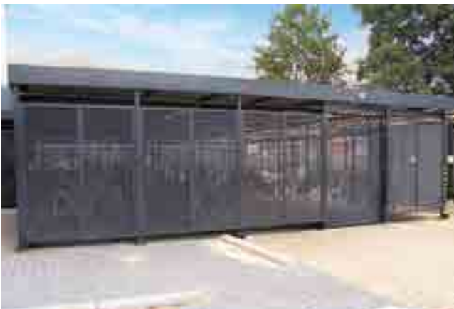
Strekmetalen wanden met schuifdeur