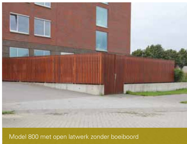
Model 800 met open latwerk zonder boelboord