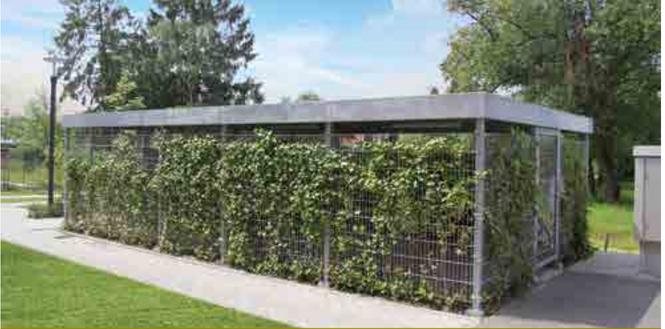
Wanden van dubbelstaafmat, bekleed met klimop