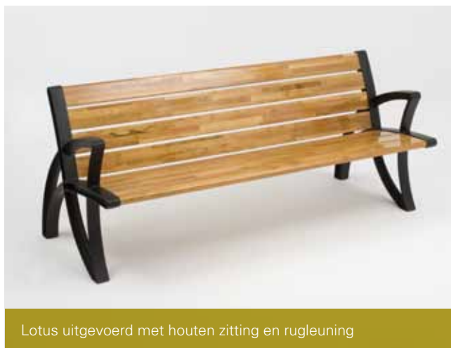
Lotus uitgevoerd met houten zitting en rugleuning