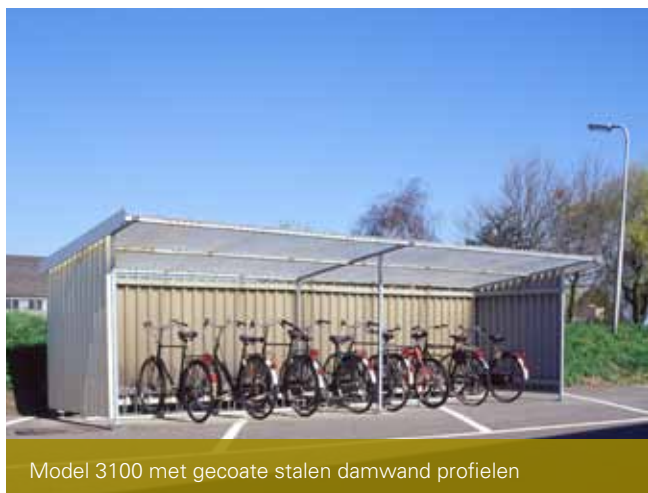
Model 3100 met gecoate stalen damwand profielen