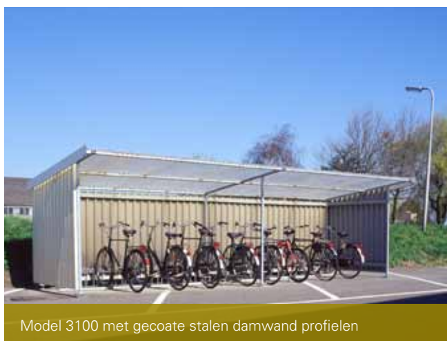
Model 3100 met gecoate stalen damwand profielen